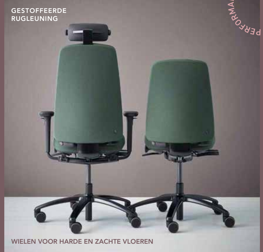
WIELEN VOOR HARDE EN ZACHTE VLOEREN