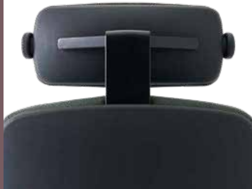
HOOFDSTEUN IN ZWART ALUMINIUM/KUNSTSTOF