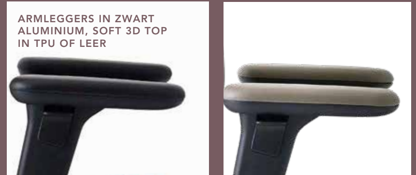
ARMLEGGERS IN ZWART ALUMINIUM, SOFT 3D TOP IN TPU OF LEER