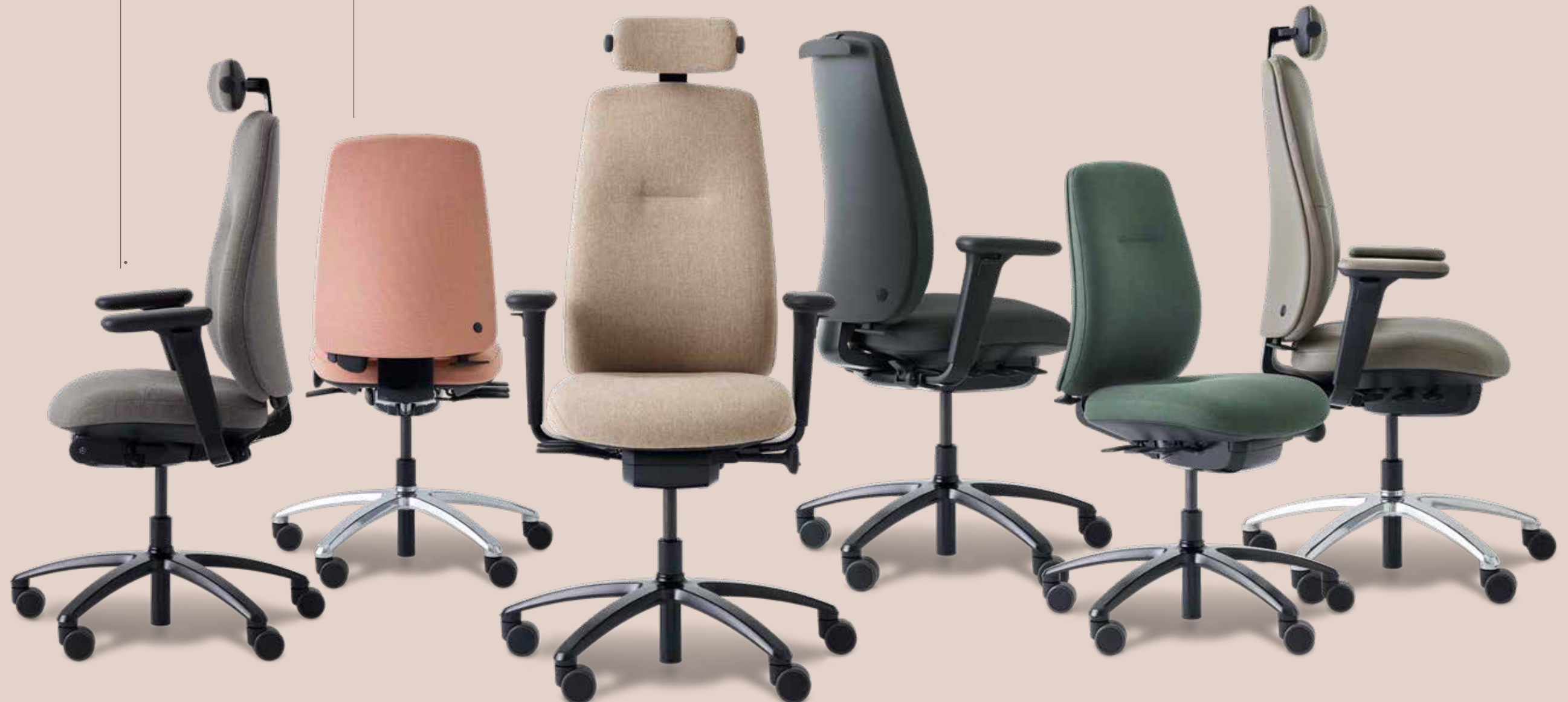
RH NEW LOGIC 200