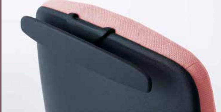
KLEDINGHANGER IN ZWART