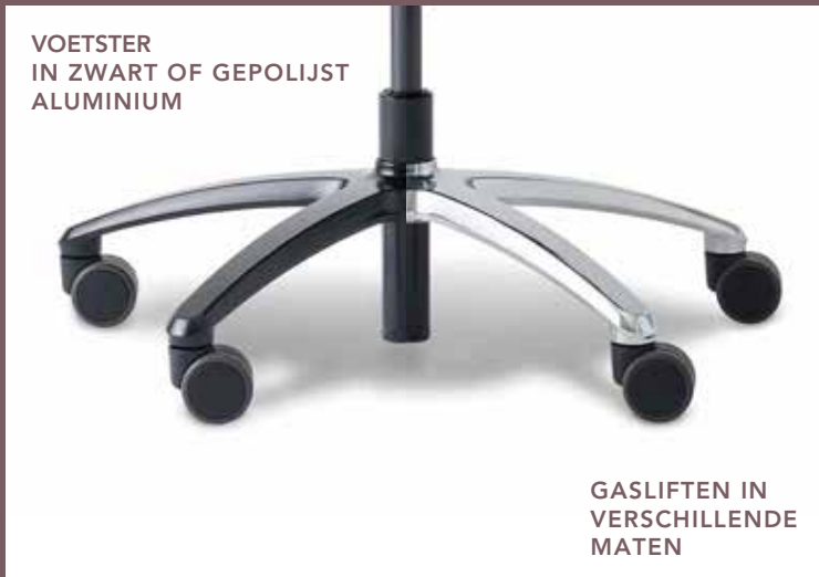
GASLIFTEN IN VERSCHILLENDE MATEN