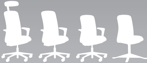
HÅG SoFi® mesh Task chair