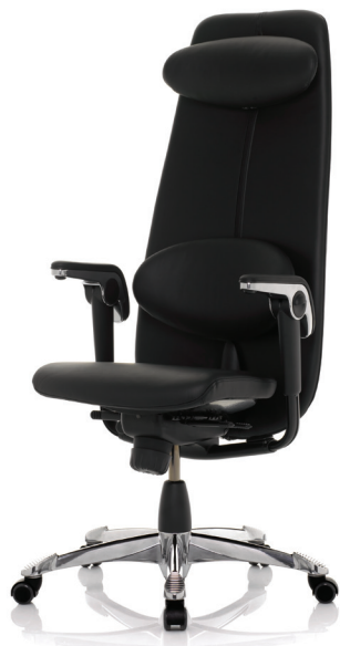
HÅG H09 Classic 9130 / Voetster in gepolijst aluminium (optie)