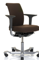
HÅG H05 5300