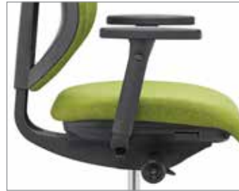
4D-armleuning kunststof- of aluminium drager