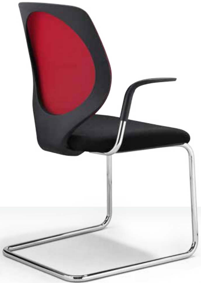
353-7002 → Rug 3D-spacer fabric → Frame verchromd