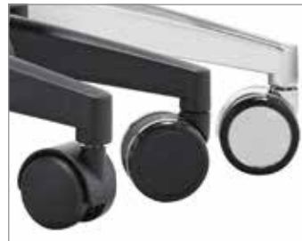
Wielen 50 mm, 65 mm zwart of verchromd