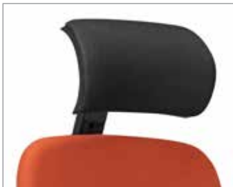
Hoofdsteen 3D-spacer fabric of gestoffeerd