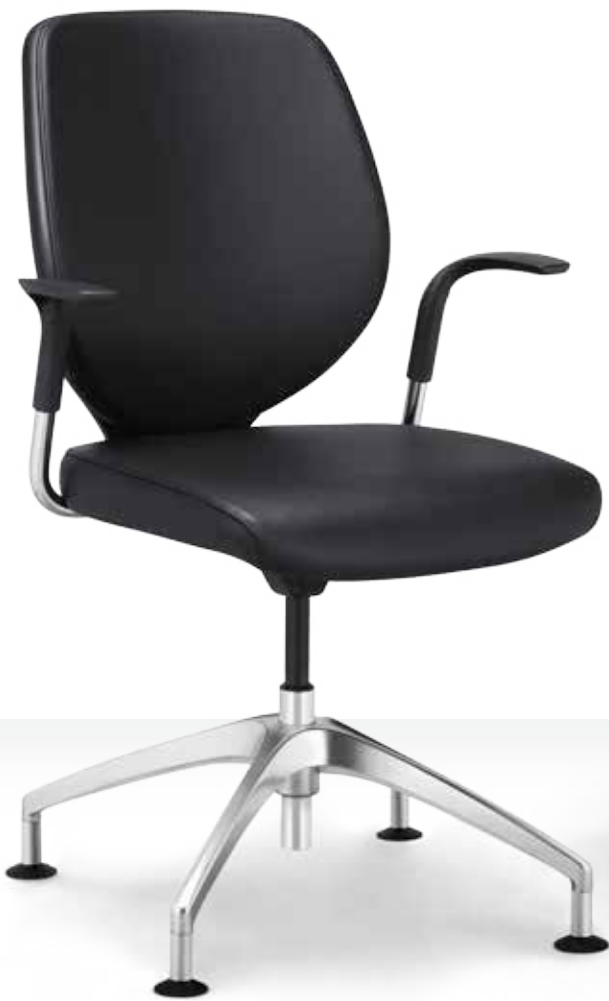
353-7518 → Lederen bekleding → Vierarmige voet gepolijst aluminium → Glijders verchromd