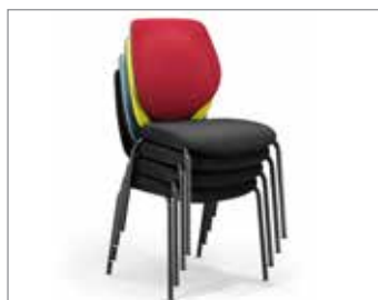
4 poten, stapelbaar

(2) uitvoering glijders in plaats van wielen