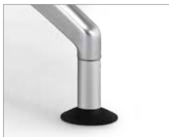
Metalen omhulsel verchromd