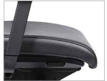
Lederen bekleding met siernaden