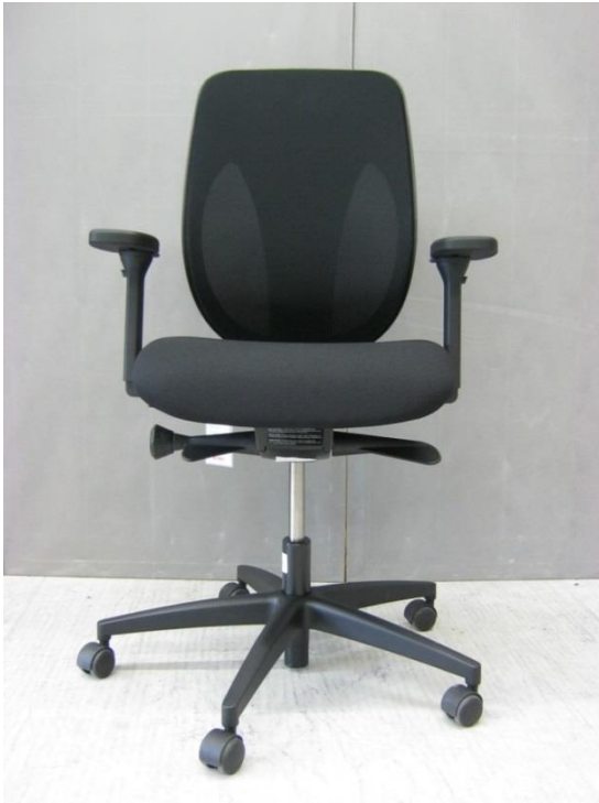
Foto 1: bureaustoel 353 van Giroflex - vooraanzicht - zitting in hoogste stand