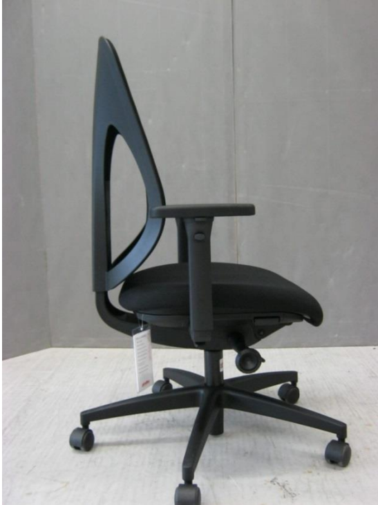
Foto 9: bureaustoel 353 van Giroflex - verstelmechanisme S in laagste stand