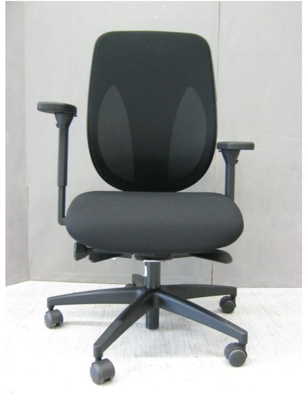
Foto 7: bureaustoel 353 van Giroflex – voor-aanzicht - armsteunen in hoogste en laagste stand