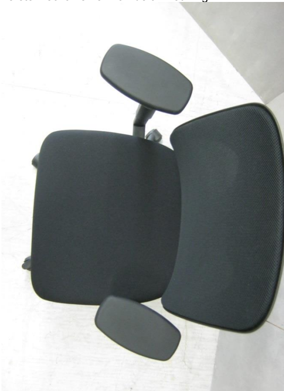
Foto 14: bureaustoel 353 van Giroflex – bovenaan zicht draai armsteunen naar binnen en naar buiten