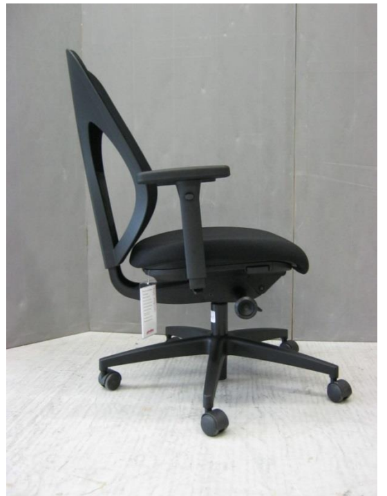
Foto 4: bureaustoel 353 van Giroflex - linker zijaanzicht - rug in achterste stand