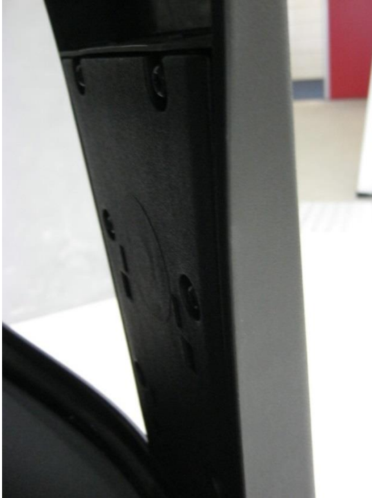
Foto 17: bureaustoel 353 van Giroflex - detail rughoogteverstelling