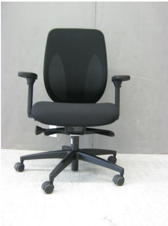
Foto 2: bureaustoel 353 van Giroflex - vooraanzicht - zitting in laagste stand