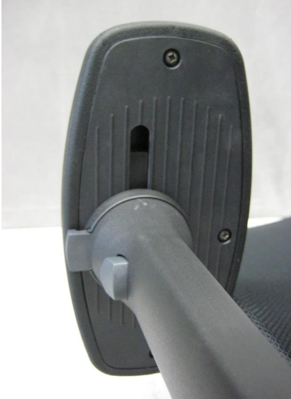
Foto 13: 1 bureaustoel 353 van Giroflex - detail verstelmechanismen van de armleuning