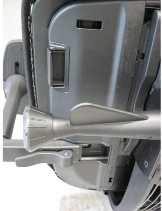
Foto 11: bureaustoel 353 van Giroflex - linker onderaanzicht verstelmechanismen