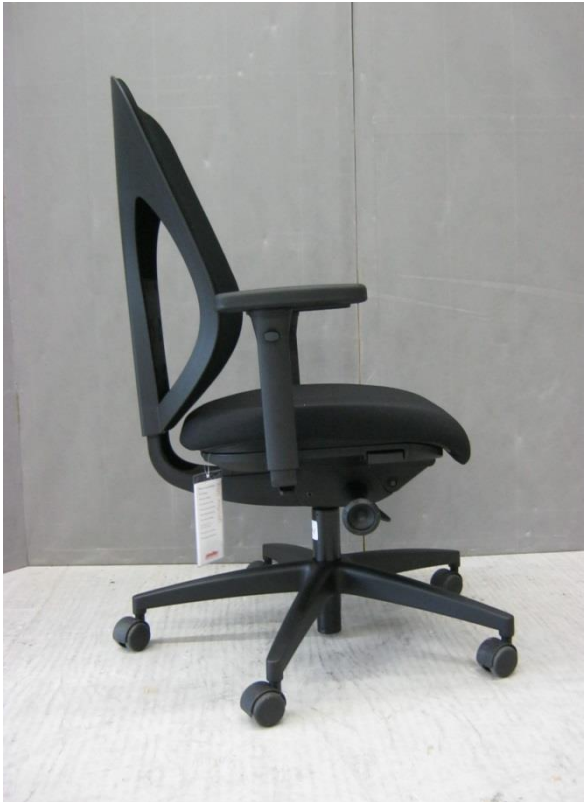
Foto 5: bureaustoel 353 van Giroflex - linker zijaanzicht - zitting in achterste stand