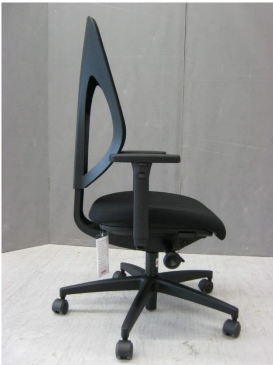
Foto 10: bureaustoel 353 van Giroflex - verstelmechanisme S in hoogste stand