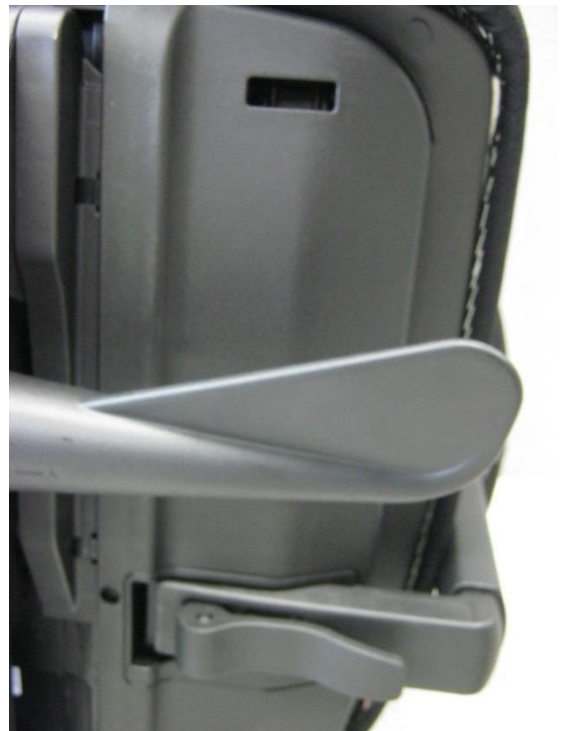
Foto 12: bureaustoel 353 van Giroflex - rechter onderaanzicht verstelmechanismen